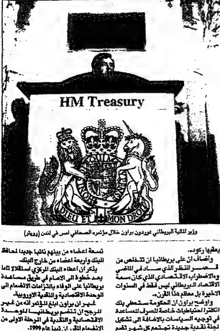
وزير المالية البريطاني غوردون براون خلال مؤتمر صحفي امس في لندن

لندن - القدس العربي: رعت حكومة حزب العمال البريطانية الجديدة امس الثلاثاء سعر الفائدة الاساسي الى 6.25 في المئة من 6 في المئة.